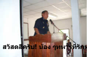
สวัสดีครับ! น้อง ๆ ทหารที่รักทุกคน