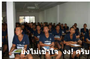
ยังไม่เข้าใจ ings! ครับ