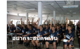
อยากจะสมัครครับ