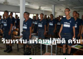
รับทราบ พร้อมปฏิบัติ ครับ

ขอแสดงความเสียใจกับสมาชิกของเราทั้งสองท่านที่จากไป