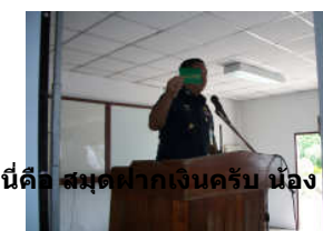
นี่คือ สมุดฝากเงินครับ น้อง ๆ