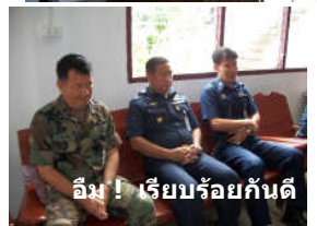
อิม! เรียบร้อยกันดี